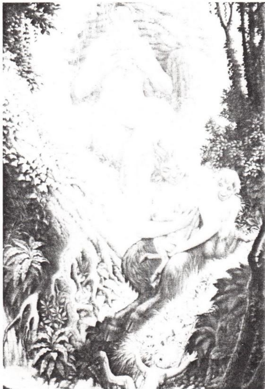
Une famille heureuse de faunes.

Il est l'héritier d'une longue tradition de peintres hollandais et s'apparente à des maîtres comme Carl Willink ou l'Autrichien Ernst Fuchs. Il utilise la technique de la sous-peinture, pré-peinture sans couleur, sorte de première couche au tableau, et la transpa-