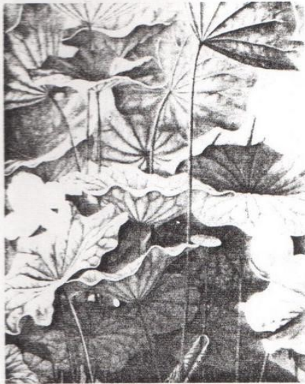
Des lotus en végétation luxuriante.

L'exposition est un voyage dans un monde onirique. Les elfes, créatures mythiques d'origines scandinaves, symbolisent les éléments : l'eau, la terre, le feu, l'air ; d'autres créatures de rêve aux noms poétiques d'Estelle et Ophélie sont des sujets centraux de certaines peintures ; le monde végétal et animal est également sacralisé : le lotus, la licorne. Les chimères vont de tableaux en tableaux, touche d'humour avec cette heureuse famille de faunes (satyres) ou cette mariée tirailée par